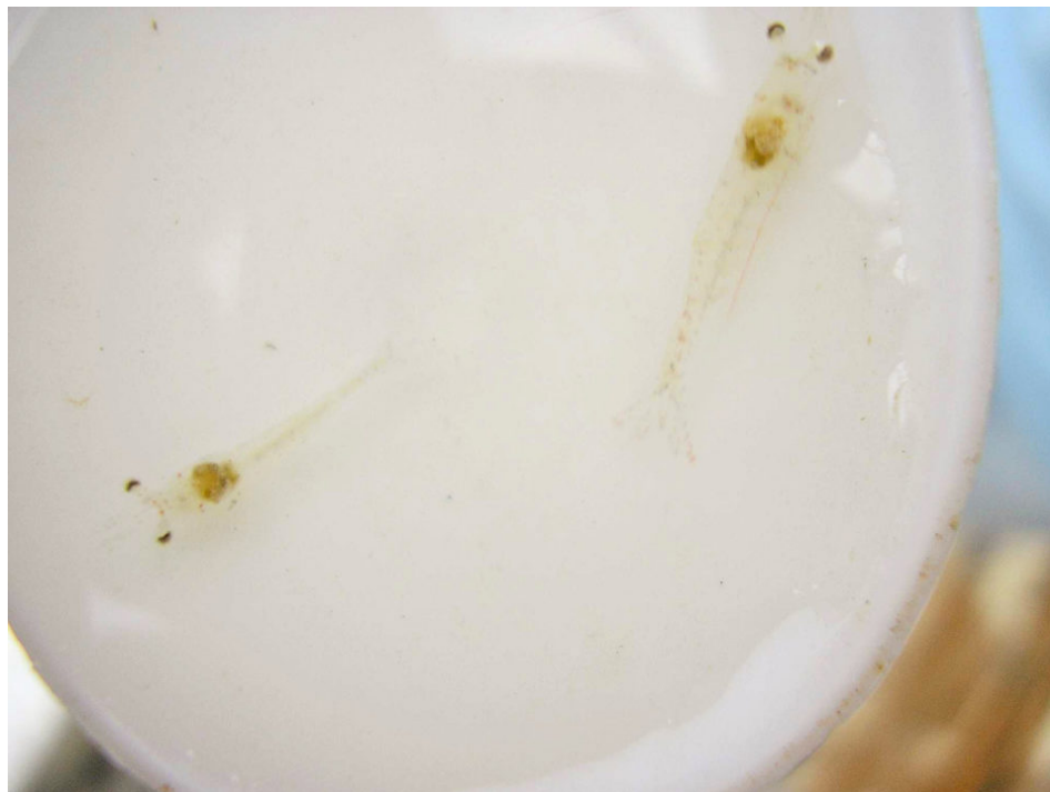
Camarón afectado PL con tripas vacías y HP pálidos.

Aproximadamente a las 7 a.m., los técnicos de pre-cría informaron a la gerencia que se observaron PL enfermas y moribundas en el tanque 6. Después de la consulta y discusión entre el personal y los gerentes a las 10 a.m., se iniciaron los pasos de intervención abajo: