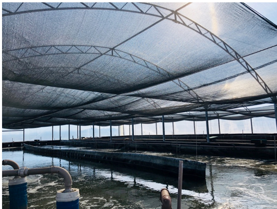
Raceways en la Estación de Acuicultura Marina, Universidade Federal de Rio Grande (FURG) en Brasil. La intensidad de la aireación es muy importante para el proceso de nitrificación en biopelículas en sistemas acuícolas con tecnología de biofloc intensivo (BFT).

Los compuestos de nitrógeno se consideran uno de los principales problemas en los sistemas intensivos y superintensivos de camarones. El amoníaco y el nitrito presentan las más altas toxicidades para los organismos producidos, afectando su crecimiento, proceso de almacenamiento, alimentación y supervivencia. Sin embargo, estos elementos pueden ser absorbidos y transformados de manera eficiente en proteínas adicionales por las bacterias presentes en los sistemas que utilizan la tecnología de biofloc (BFT).