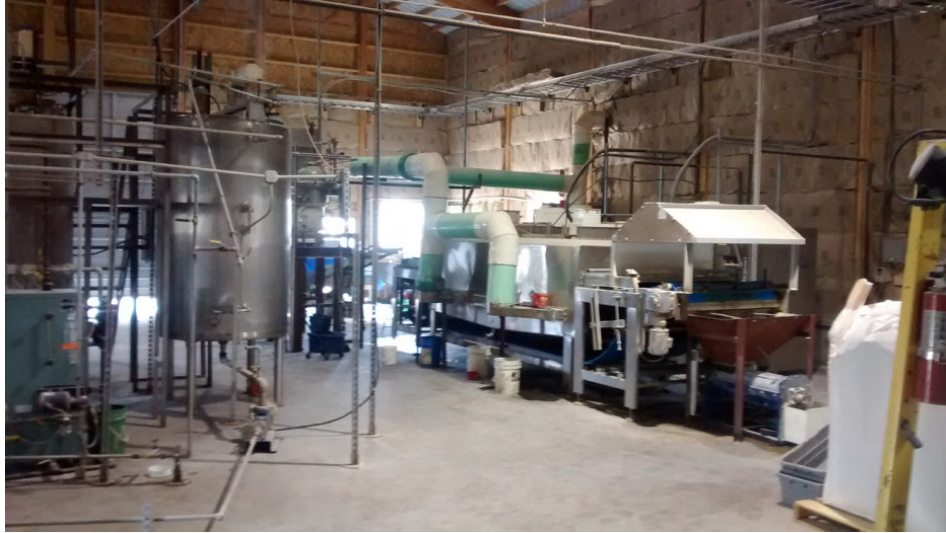
Una mirada al interior de la planta piloto de Montana Microbial Products en Melrose, Montana.

Un co-producto de este proceso de fabricación ahora patentado por separado tiene un gran valor, agregó: “Producimos mucha glucosa. Las grandes plantas de fermentación necesitan una fuente de azúcar.”