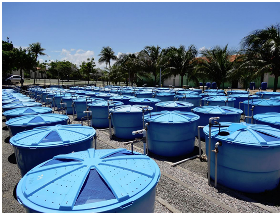
Vista del sistema experimental de cría utilizado en el estudio.