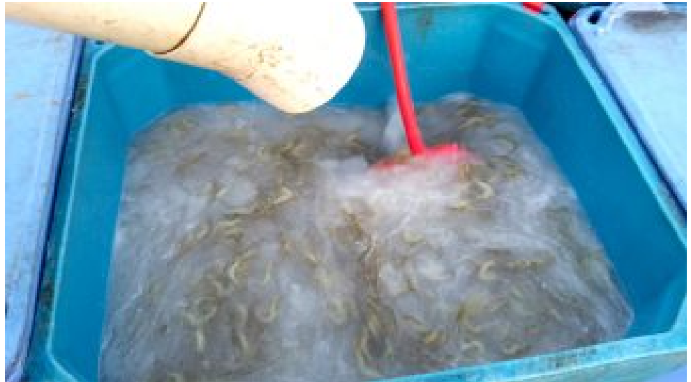
Mezclando camarones en slurry de hielo en un bin durante una cosecha.

Cuando los crustáceos mueren, la oxidación y las reacciones enzimáticas inducirán el ennegrecimiento de los animales, y esto se llama melanosis o mancha negra. Es una decoloración u oscurecimiento inofensivo que ocurre en la cabeza, la cola, los apéndices natatorios y otras partes del cuerpo del camarón. Este es un fenómeno bien conocido que no tiene impacto en el sabor del producto y no es una indicación de deterioro bacteriano del producto, pero la apariencia puede ser repulsiva para los consumidores. Si es necesario, se puede evitar la melanosis con el uso de productos anti-oxidantes.