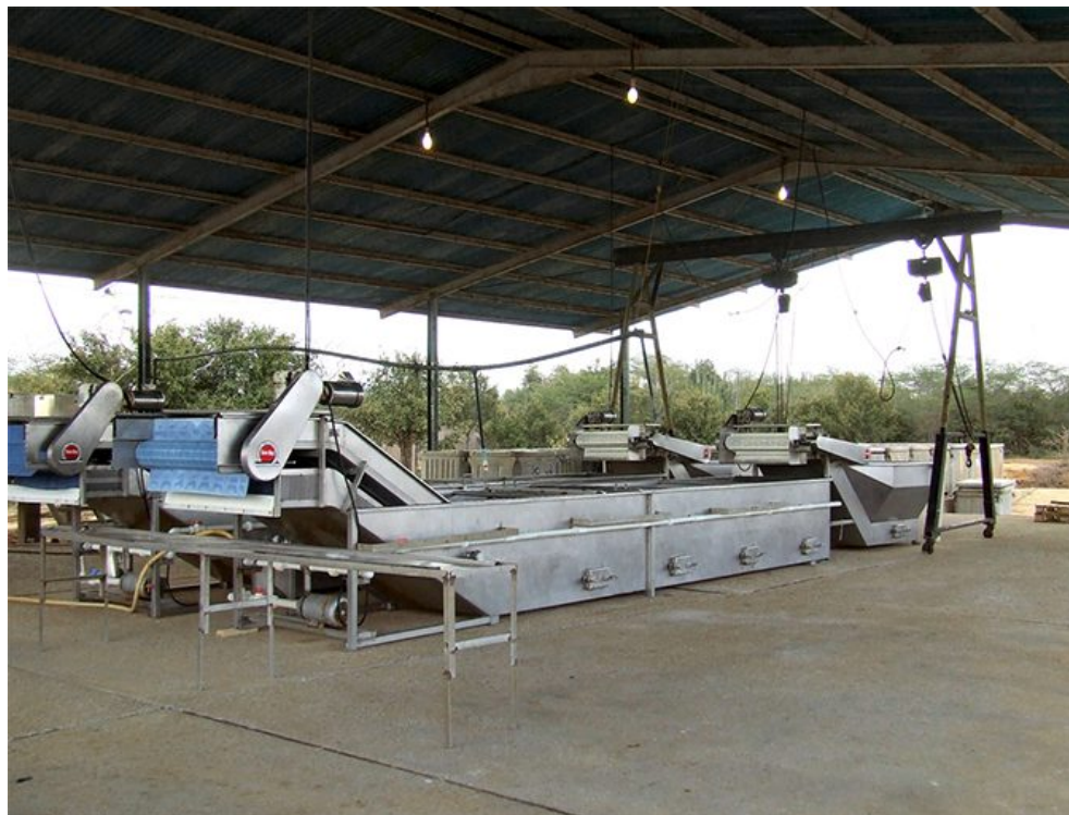
Equipo para el tratamiento mecanizado de SMBS en una granja de camarón en Venezuela.

El mejor enfoque consiste en enfriar los camarones en la granja durante la cosecha, y drenar el recipiente (bin) tan pronto como la temperatura de los camarones baja por debajo de 2°C. Si el camarón alcanza una temperatura inferior a 2°C, se pueden mantener sin riesgo de desarrollo de melanosis durante más de 10 horas.