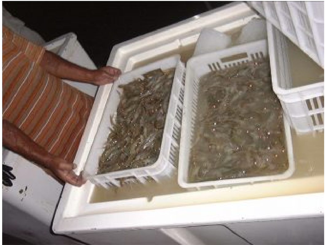
Cosecha de camarones utilizando cestas en una granja de camarones en Irán.

Un enfoque común es utilizar 600 litros de agua y hielo mezclados, o slurry de hielo (50 por ciento de hielo y 50 por ciento de agua) por cada 400 kg de camarones. La cantidad de sal debe ser determinada empíricamente con anterioridad al hacer pruebas en la granja y en las condiciones que serán prevalente durante la cosecha. Las cantidades variarán en relación con la composición del agua, temperatura del camarón cosechado y su tamaño, y otras variables. Por lo tanto, los números de arriba son una guía general derivada de la experiencia. Este es un paso importante, que se debe hacer con cuidado. Si no hay suficiente sal la mezcla no es eficiente. Pero si hay sal en exceso la temperatura de los camarones podría ser demasiado baja (por debajo de 20°C), lo que sería indeseable.