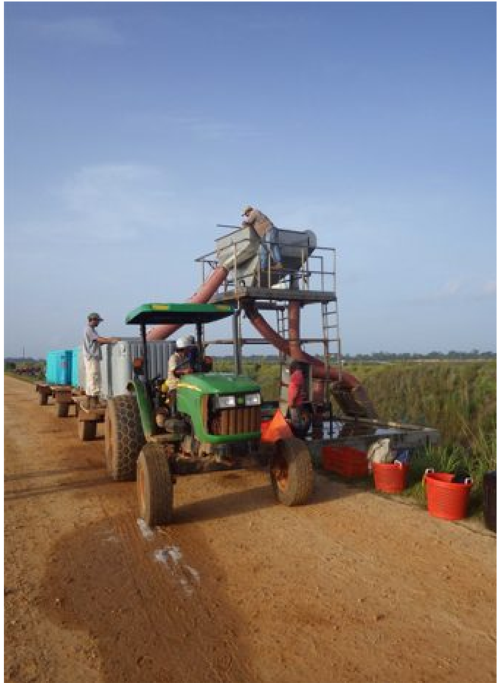
Cosecha de camarones usando bines en una granja camaronera en Belice.