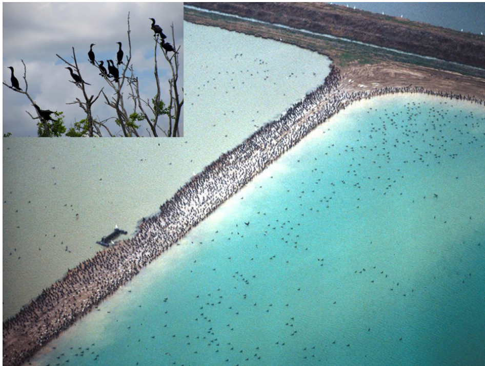
Fig. 4: Vista aérea de cormoranes que se alimentan en una unidad de producción de peces.

En los sistemas de criaderos y recirculación, los aspectos a considerar son el suministro de agua subterránea libre de enfermedades, huevos/peces SPF, alimentos SPF, nutrición óptima, monitoreo de la salud de los peces, unidades fáciles de limpiar, opciones para la eliminación de peces muertos, procedimientos de desinfección y mantenimiento de registros. Las estrategias de vacunación específicas para la granja y rentables ofrecerán resistencia a varios patógenos, buena salud y una productividad mejorada (Fig. 5).