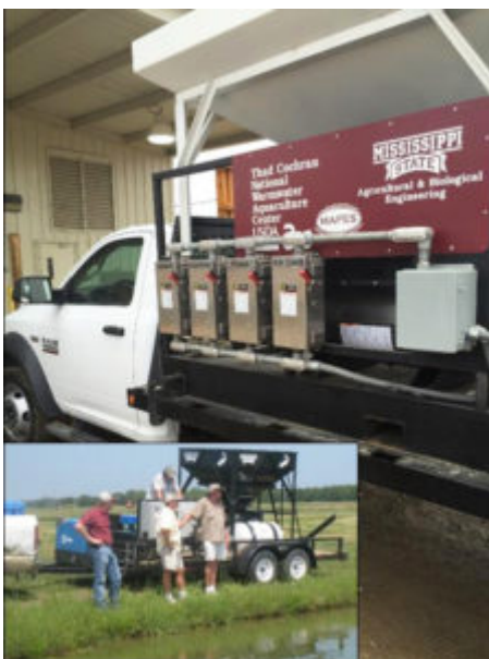
Fig. 5: El sistema de entrega de vacunas de bagre (patente pendiente) desarrollado por el Centro Nacional de Acuicultura de Aguas Cálidas y el Departamento de Agricultura e Ingeniería Biológica de

En los sistemas de criaderos y recirculación, los aspectos a considerar son el suministro de agua subterránea libre de enfermedades, huevos/peces SPF, alimentos SPF, nutrición óptima, monitoreo de la salud de los peces, unidades fáciles de limpiar, opciones para la eliminación de peces muertos, procedimientos de desinfección y mantenimiento de registros. Las estrategias de vacunación específicas para la granja y rentables ofrecerán resistencia a varios patógenos, buena salud y una productividad mejorada (Fig. 5).